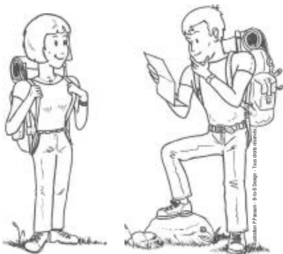
Illustration P.Pasani - B to B Design - Tous droits réservés