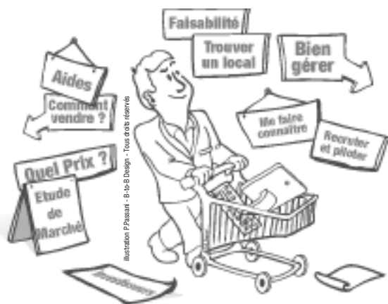
Illustration P.Pasart - B to B Design - Tous droits réservés