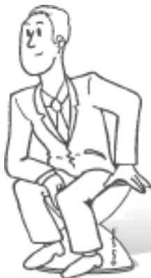
Illustration P. Prassani - B-to-B Design - Tous droits réservés

L'objectif est de mener une bonne idée d'activité innovante vers son exploitation industrielle, commerciale et financière de manière pérenne.